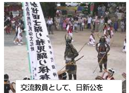
交流教員として、日新公を務めさせていただきました