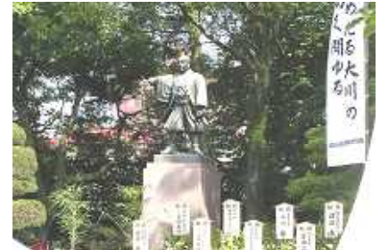
薩摩義士頌徳慰霊祭

鹿児島との交流によって、岐阜の良さを改めて知る機会にもなりました。それ以来、伝統を重んじ、その良さを継承してこそ、明るい未来があると信じて一日一日を大切にしています。